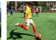
Vive la pasión del fútbol