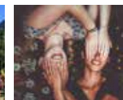
ACTIVE ADVENTURE CAMP