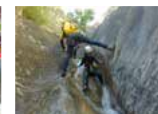
Vive mil aventuras