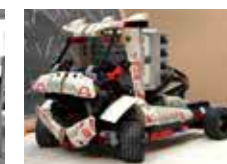
La magia de la ciencia y la tecnología