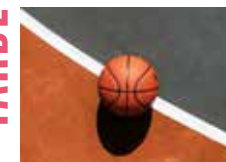
Bloquea, tira y encesta