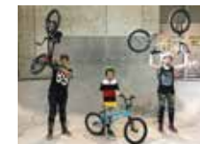
Freestyle en estado puro