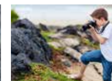
Plasma tus emociones