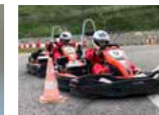
Aprende a pilotar

¡PIDE EL CATÁLOGO EXCLUSIVO DE CAMPAMENTOS 2019!