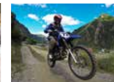
Aprende, derrapa y salta