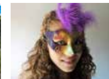
Atrévete a ser el protagonista