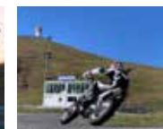
RACING MOTO CAMP