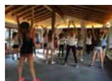
Disfruta la sensación del baile