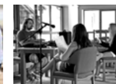
Expresa tu talento musical