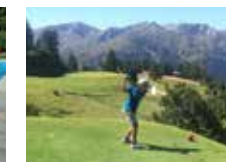
Un deporte con estilo