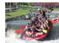
La mejor aventura