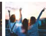
MULTI ADVENTURE CAMP