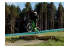
Un descenso apasionante