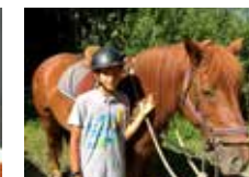
Equitación en plena naturaleza