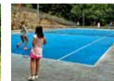
Mejora tus golpes